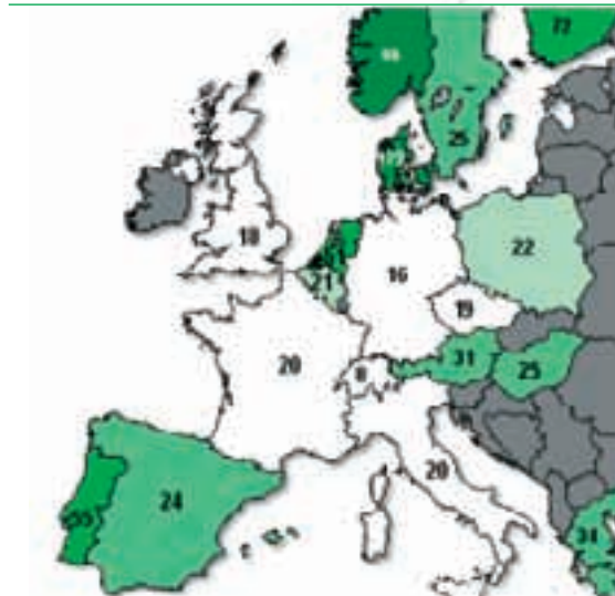
Niveaux de taxation en % du prix